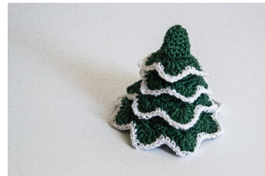
Erste Runden des Tannenbaumes