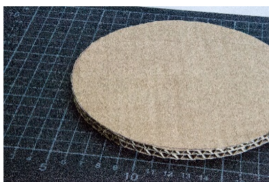
Pappscheibe aus Wellpappe