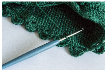
in den hinteren M-Gliedern f M häkeln und die Abschlusskante mit 4 Rd. arbeiten