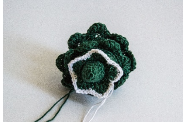
weiße Kante, Sonderrunde c)