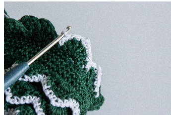
Abschlusskante (Sonderrunde c) in weiß

Alle Modelle, Zeichnungen und Bilder stehen unter Urheberschutz. Eine Verwendung, die über die private Nutzung hinausgeht, ist ohne Zustimmung der Schoeller Süssen GmbH nicht gestattet.